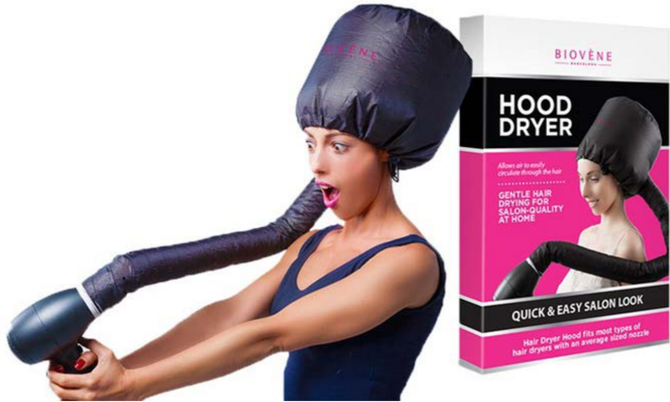
Le bonnet séchoir